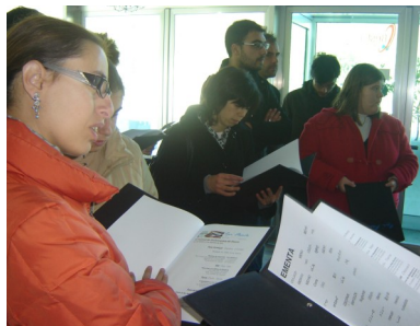
Visita guiada pelo Restaurante DOC

No dia 13 de novembro nós Formandos dos Cursos 8/9/10 Assistente Familiar e de Apoio à Comunidade fizemos uma visita de estudo ao Restaurante DOC ,na Folgosa. Nessa visita a Chefe de Sala começou por nos mostrar e explicar a disposição das mesas da sala de jantares. Transmitiu-nos também que a maioria destas salas eram reservadas para pessoas vindas de hotéis e barcos que param nessa zona, havendo assim uma parceria de interajuda. Explicou-nos que neste tipo de serviços tem que se ser muito explícito no que diz respeito ao cardápio das refeições estando sempre atentos à época do ano .