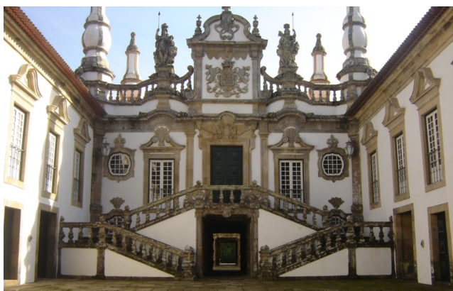
Palácio de Mateus - Vila Real

Os formandos do Curso 7 Assistente Familiar e de Apoio à Comunidade