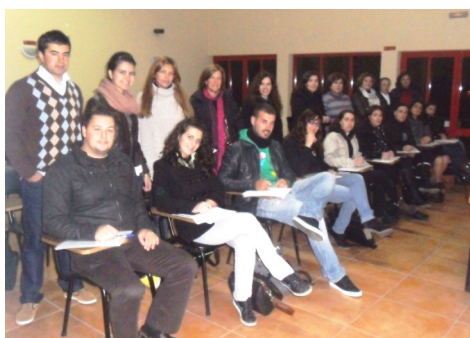
Formandos do curso de Crianças com Necessidades Específicas de Educação (NEE)