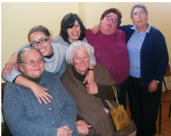
Momentos de amizade entre os formandos da A2000 e os idosos dos Espaço Convívio de Medrões.

No final, ficou a promessa de se repetir esta experiência mais vezes.