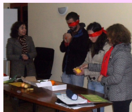
Atividade Prática no curso NEE

A A2000 proporciona-nos a oportunidade de beneficiar destas formações, o que é uma mais valia, pois assim podemos melhorar as nossas competências pessoais, intelectuais e sobretudo profissionais. Podemos adquirir novos conhecimentos e ver a realidade da vida das crianças especiais.