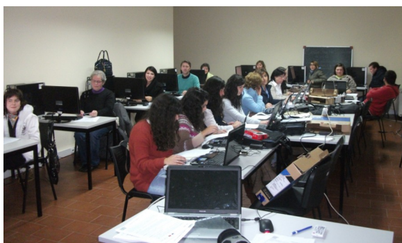
Grupo do curso de Folha de Cálculo