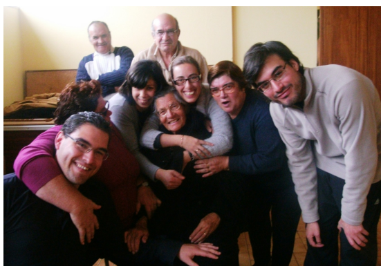
Formandos da A2000 e os idosos dos Espaço de Convívio de Medrões.

O Magusto é uma festa popular, cujas formas de celebração divergem um pouco consoante as tradições regionais. Grupos de amigos e famílias juntam-se à volta de uma fogueira onde se assam castanhas para comer, bebe-se a jeropiga, água-pé ou vinho novo, fazem-se brincadeiras, as pessoas enfarruscam-se com as cinzas e cantam-se cantigas ( Wikipédia, a enciclopédia livre ).