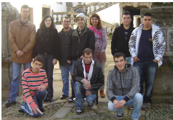
Formandos no Palácio de Mateus