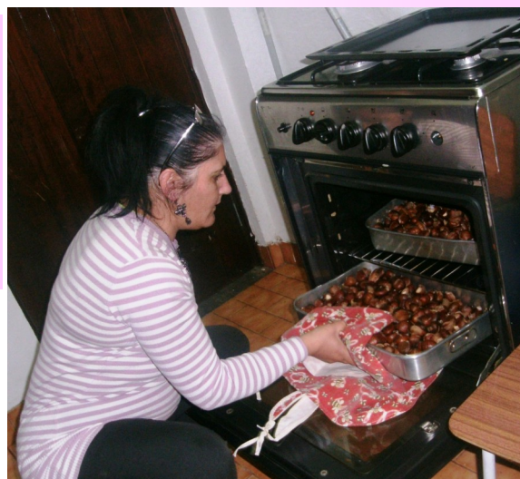
A fogueira foi substituída pelo fogão: Formanda da A2000 a tratar das castanhas para o lanche.