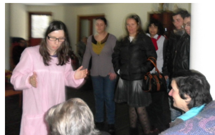
Visita guiada pela Santa Casa da Misericórdia de Mesão Frio

Agradecemos à Santa Casa da Misericórdia de Mesão Frio pela forma simpática com que nos recebeu.