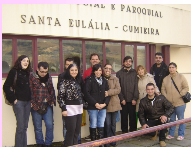
Formandos no Centro Social e Paroquial de Sta. Eulália - Cumieira -

Formandos dos cursos 8/9/10 de Assistente Familiar e de Apoio à Comunidade