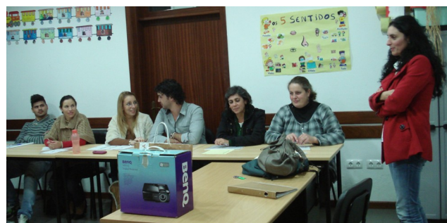
Grupo do curso de Língua Inglesa - Documentação Administrativa - Santa Marta de Penaguião -