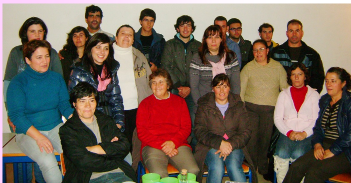
Grupo do curso de Higiene da Pessoa Idosa em Lares e Centros de Dia - Oliveira, Mesão Frio -