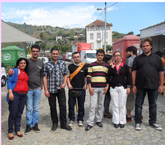
Formandos do Curso de Assistente Familiar e de Apoio à Comunidade

Antes de regressarmos à Associação 2000 ainda tivemos tempo de comer um gelado.