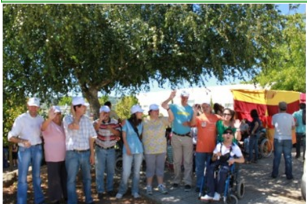
Clientes da Oficina dos Sorrisos

No dia 4 de Julho fomos à APPACDM de Sabrosa e participamos na “Há Festa na Praça” onde foi apresentado o resultado do concurso dos Espantalhos - o nosso infelizmente não ficou em primeiro lugar. Havia uma feira com vários produtos feitos pelos jovens de lá e várias atividades para nós fazermos durante o dia.