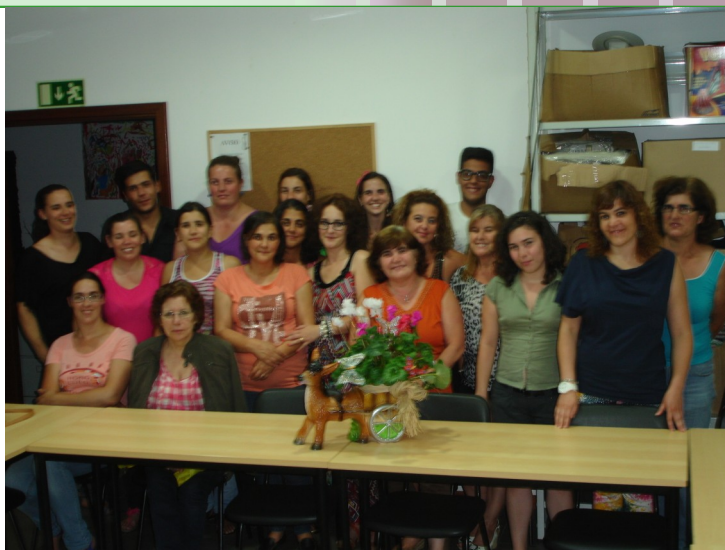
Formandos do curso “Atividades pedagógicas do quotidiano da criança” - Santa Marta de Penaguião -

Realçamos a importância da formação dentro desta área uma vez que para além de ser útil para o dia a dia profissional de quem já trabalha em instituições de apoio á infância, também é útil no nosso dia a dia a nível pessoal.