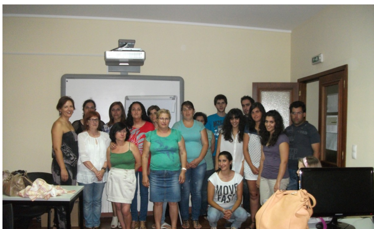
Formandos do curso “Noções sobre células, imunidade, tecidos e órgãos - Sistema osteoarticular e muscular”

O curso foi bem sucedido, a formadora explicou muito bem os conteúdos previstos, aprendemos várias noções sobre as células, o que se revelou de extrema importância, pois muitos de nós não temos noção de como o nosso corpo é capaz de reagir a várias situações que possam surgir.