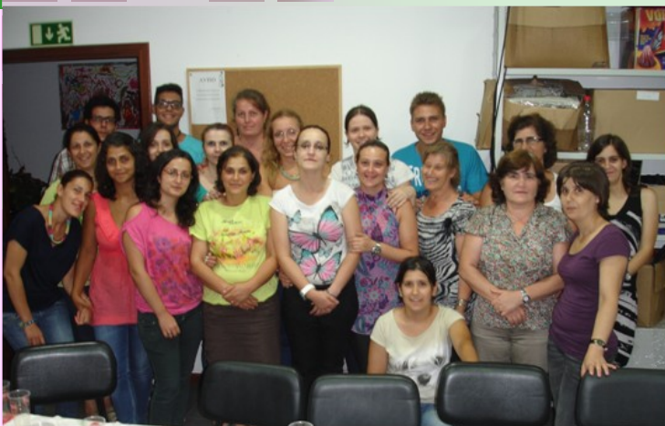
Formandos do curso “Prevenção de doenças e acidentes na infância” - Santa Marta de Penaguião -

No dia 26 de Junho de 2013, nas instalações da A2000, iniciou mais uma formação denominada “Prevenção de doenças e acidentes na infância”, Unidade de Formação de Curta Duração (UFCD) nº 3273, retirada do Catálogo Nacional de Qualificações, num total de 50 horas.