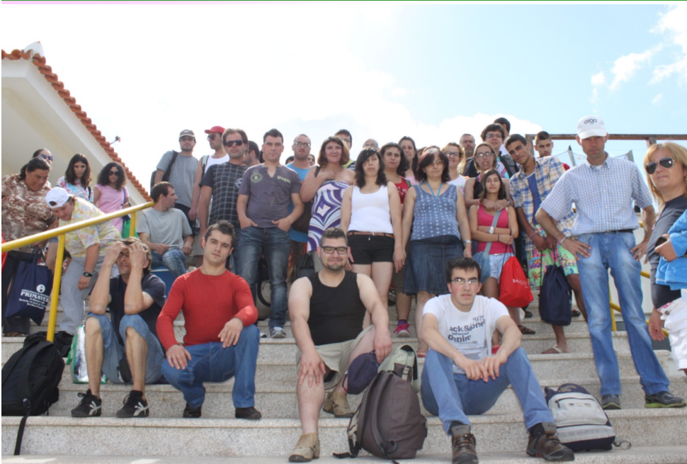
Cientes da A2000 à chegada ao Natur Waterpark

No dia 29 de Julho, a A2000 privilegiou os clientes da Tipologia de Intervenção 6.2 “Qualificação de Pessoas com Deficiência ou Incapacidades” e os clientes da Oficina de Sorrisos com um dia de pura adrenalina, convivência, cooperação e razão para uma boa fotografia, sendo nesta “partitura” que depois de um entendimento e acordo entre as partes - A2000 e a Natur WaterPark (Parque de Diversões do Douro, que está situado na Quinta do Barroco, Póvoa/Andrães, às portas da cidade de Vila Real) - foi-nos a nós, clientes da A2000, possibilitado um dia excêntrico, refrescante e bom para a nossa vista, ou não estivessem por lá “montes” de cataratas que para quem não tem receios de andar nas suas plataformas nos provocou sensações que ficarão para mais tarde recordar .