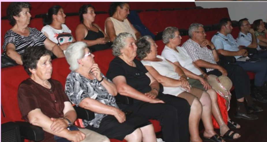
Participantes na ação de sensibilização - Violência na 3.ª Idade