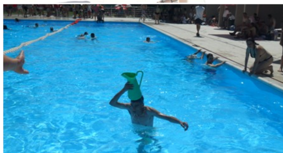
Formandos do curso 7- Assistente Familiar e de Apoio à Comunidade no XII Encontro da ARDAD