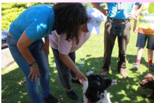
Os clientes da Oficina dos Sorrisos

Neste passeio conhecemos outra terra diferente e outras pessoas, com quem conversamos e nos divertimos. Foi um dia diferente e divertido. Gostamos muito.