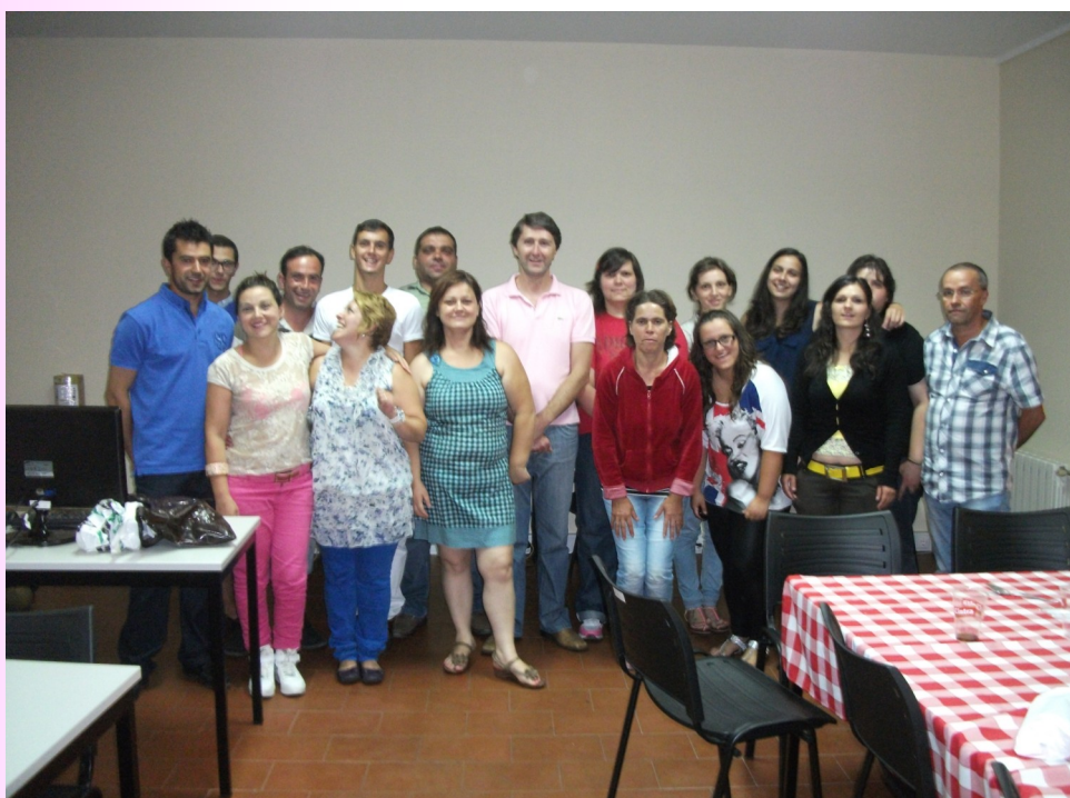
Formandos do curso “Crianças com necessidades específicas de educação - NEE” - Mesão Frio -

Este curso, acima de tudo, serviu para nos sensibilizar para este tema das NEE. Também ajudou a qualificar-nos, para que um dia possamos ser profissionais conscientes da diferença.