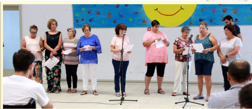
Técnicos do Gabinete Psicossocial