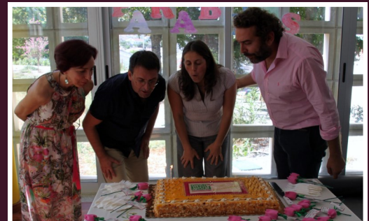
Tabuaço e Armamar