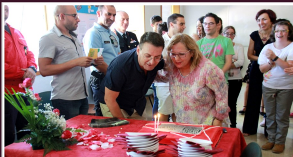
Chaves e Vila Pouca de Aguiar