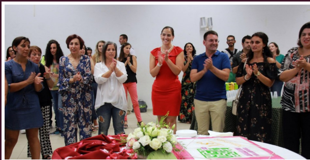
Santa Marta de Penaguião e Vila Real